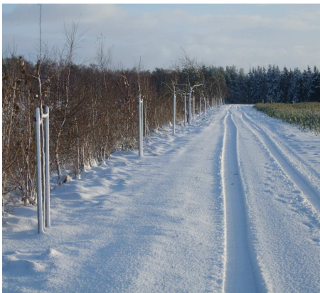
Platenhof - alte Obstsorten