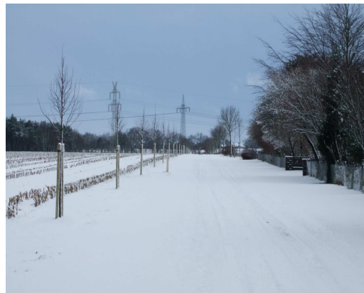
Taaken - Schlippenmoorweg