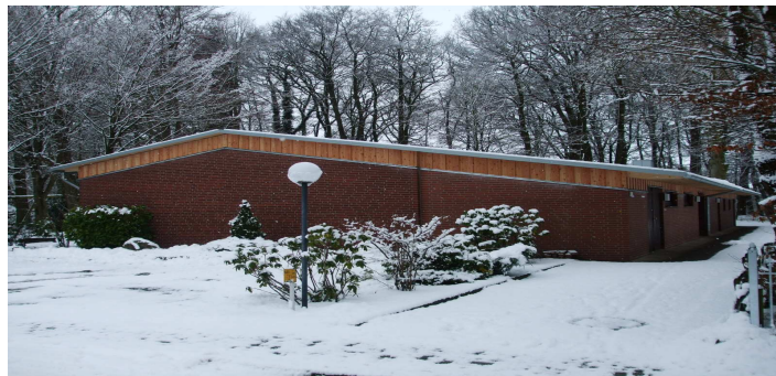
Die neue Kopfbedeckung des DGH macht sich sehr gut

Verbunddorferneuerung : In 2010 durchgeführte Projekte Sanierung des DGH Clüversborstel und überörtliche Pflanzmaßnahmen